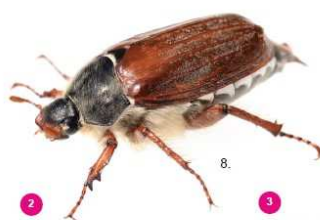
2 Melolontha melolontha Il comune maggiolino, 25-30 mm, non possiede ciuffi bianchi.